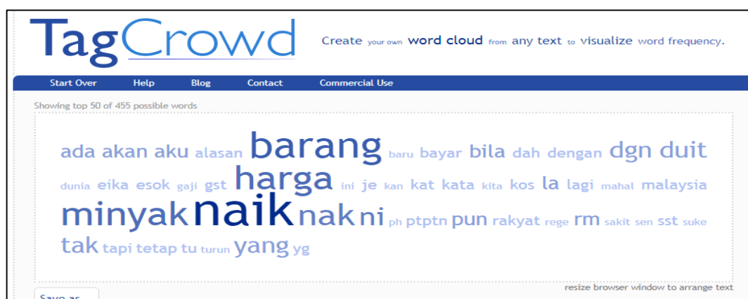
Gambar 1.0. Bukti penyerlahan leksikal bagi tema ekonomi menggunakan aplikasi Tagcrowd .

Semasa tempoh penelitian data, sebanyak 10 944 token yang digunakan telah membantu penyelidik mendapatkan bukti-bukti leksikal melalui aplikasi Tagcrowd dengan terserlahnya leksikal seperti [naik], [barang], [cukai], [harga], [minyak], [duit], [bayar], [gaji], [mahal], [rakyat], [RM], [gst], [sst], [ptptn] seperti dalam gambar 1.0 di bawah.